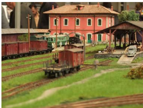
Estació d'Olot, mòdul ASAMTOG, foto ASAMTOG